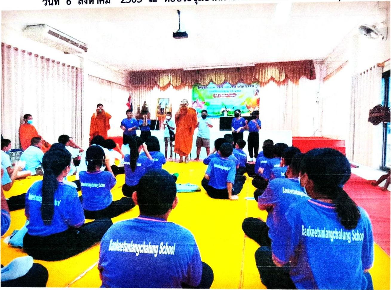
ภาพ : โครงการอบรมคุณธรรม จริยธรรม ประจำปีงบประมาณ พ.ศ.2565 วันที่ 6 สิงหาคม 2565 ณ หอประชุมองค์การบริหารส่วนตำบลท่าจะหลุง