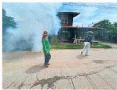
รูปภาพ การออกพ่นหมอกควันเพื่อควบคุมและป้องกันโรคไขเลือดออก ภายในพื้นที่ตำบลท่าจะหลุง