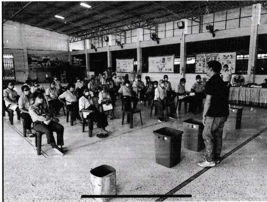
ภาพ การให้ความรู้เกี่ยวกับการจัดการขยะในครัวเรือน